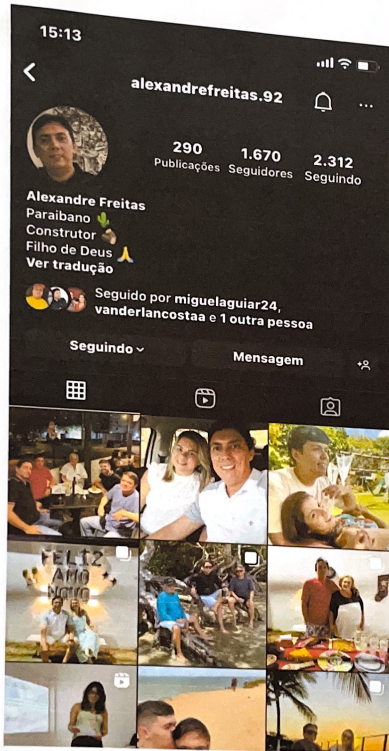
(Instagram de Alexandre Freitas)

Neste norte, existe fortes indícios de estar ocorrendo direcionamento na vitória destas empresas nas licitações realizadas pelo município, conforme acima relatado, de